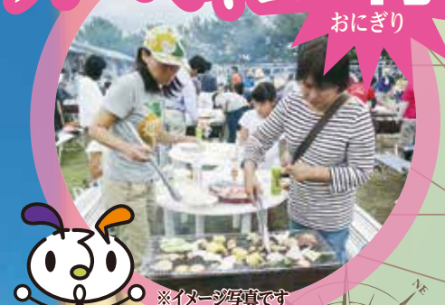
※イメージ写真です