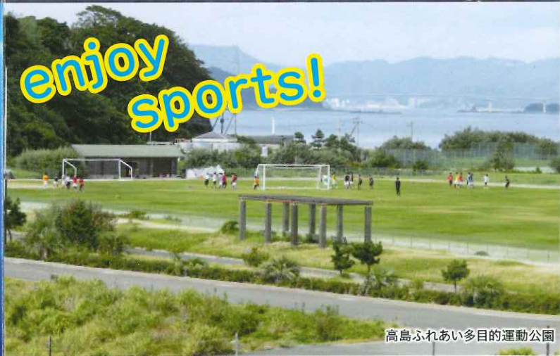
高島ふれあい多目的運動公園